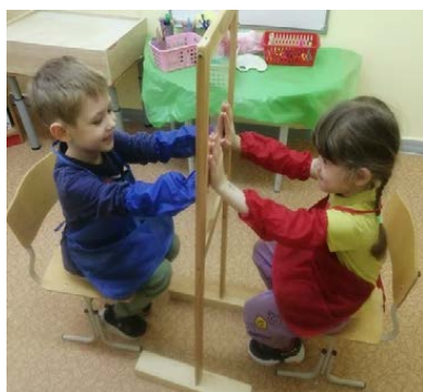
Рис. 1. «Здравствуй друг»

Новизна использования прозрачного арт-мольберта заключается в том, что выполняя работу стоя или сидя, ребенок может свободно двигаться, что является естественной потребностью в любом возрасте. К тому же работа на арт-мольберте стимулирует познавательную активность ребенка, вызывая у него положительный эмоциональный отклик, позволяет фиксировать его внимание на происходящем и доставляет радость от творчества и возможность совершить ошибку и при этом сразу же ее исправить, тем самым создается ситуация успеха. Дети ощущают незабываемые, положительные эмоции, а по эмоциям можно судить о настроении ребенка, о том, что в данный момент радует, интересует, повергает в уныние, волнует ребенка, что характеризует его сущность, характер, индивидуальность (рис. 1, 2).