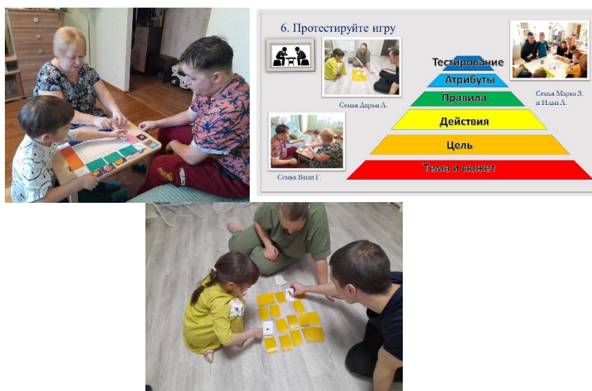
Рис. 8. Этап «Тестирование»

Для вовлечения родителей в образовательный процесс, развития ответственного и осознанного родительства как базовой основы благополучия семьи, в алгоритм создания игры включен этап «Тестирование» (рис. 8). Все созданные игры дети тестируют дома с родителями. Поиграв всей семьей, родители делятся с нами впечатлениями, вносят предложения по усложнению или корректировке игры.