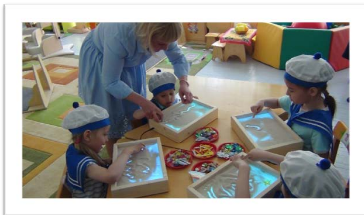
Рис. 3. Центр игровой поддержки и социальной интеграции «Игралочка»

комплекса средств адаптивной физической культуры, которая позволяет повысить эффективность непосредственно образовательной деятельности, что положительно повлияет на физическое, психическое и эмоциональное благополучие детей;