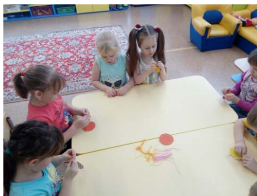
Рис. 10. «Масленичное солнышко»

2. «Масленичное солнышко» – непременно атрибутом Масленицы являются блины, которые олицетворяют солнце – символ того самого уюта и тепла, ну и, конечно, веселья. Детям предоставили возможность создать собственное солнышко (рис. 10).