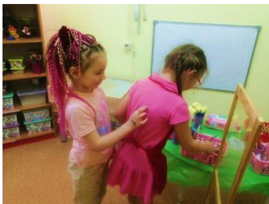
Рис. 7. «Рисуем на спине»

«Рисунок на спине» – развитие коммуникативных навыков, развитие тактильного восприятия, воображения (рис. 7, 8).