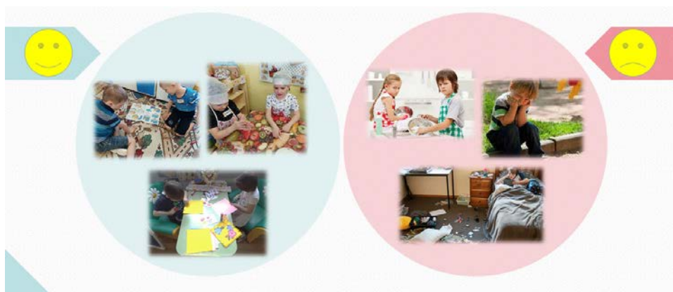
Рис. 1. Трудовая деятельность детей дошкольного возраста

На сегодняшний день проблемы трудового воспитания достаточно актуальны для детей дошкольного возраста, так как на этом этапе происходит формирование нравственных и культурных ценностей, в том числе такой ценности, как «труд». В раннем возрасте ребенок, подражая взрослому, с удовольствием выполняет трудовые действия. В старшем дошкольном возрасте труд для детей становится скучным и неинтересным занятием, поскольку они не знают, как выполнять то или иное задание. И мы, взрослые, в свою очередь, спешим сделать все сами, хорошо и быстро, не давая детям возможности поучаствовать, проявить инициативу, тем самым воспитывая потребителей (рис. 1).