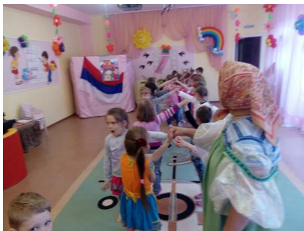
Рис. 2. «Подвижные игры Урала»

3. «Подвижные игры Урала» – дети познакомились и поиграли в игры народов, проживающих на Урале (рис. 2).