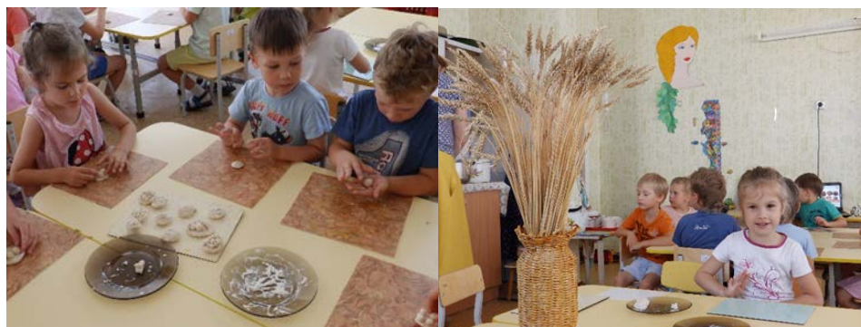
Рис. 7. «Хлебный Спас»

3. «Хлебный Спас» – детей познакомили с одним из народно-православных праздников «Хлебным Спасом» и его традициями. Затем дети из соленого теста стряпали хлеб (рис. 7).