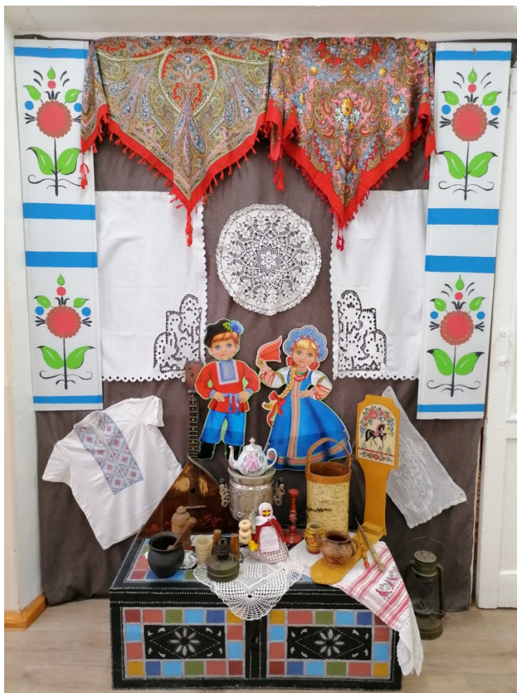
Рис. 3. Поддержка семейных традиций и ценностей семьи

Успешно реализован долгосрочный проект «Семейные ценности» (рис. 4). В ходе которого решились следующие задачи: