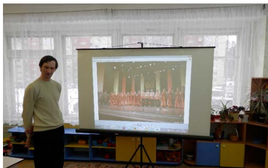
Рис. 4. «Горный ленок»

3. «Горный ленок» – папа воспитанницы детского сада, участник народного хора «Горный ленок» дворца культуры имени М. Горького АГО, показал детям видеопрезентацию о хоре народной песни, исполнил вместе со своей дочерью уральскую народную песню, которую разучил со всеми детьми (рис. 4).