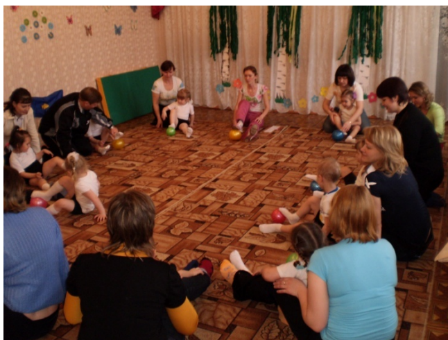
Рис. 1. Включение родителей в образовательный процесс

Еще одним трендом просветительской деятельности родителей стало осознание значимости развития различных навыков у детей. Современные родители все больше понимают, что важно не только развивать интеллект своих детей, но и их эмоциональную, социальную и физическую сферы. Они активно ищут методики и программы, которые помогут детям стать компетентными и успешными во всех аспектах жизни [5].