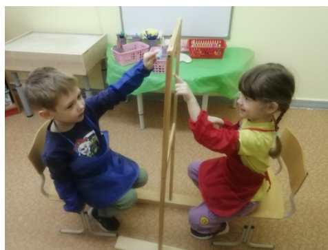
Рис. 5. «Догони»