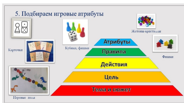
Рис. 7. Пятый этап алгоритма создания игры «Пирамида Мастера игры»

6. Важнейшим условием эффективной работы по развитию детской инициативы – взаимодействие с семьями воспитанников.