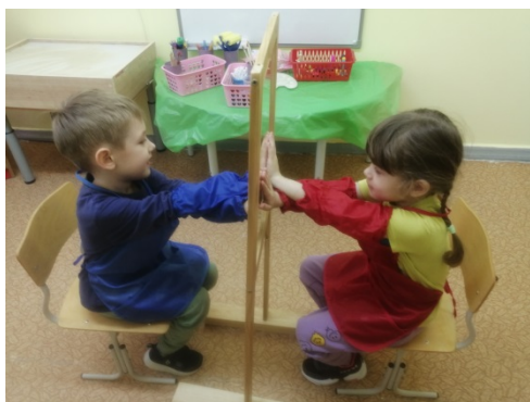
Рис. 4. «Здравствуй, друг»

«Здравствуй, друг», «Догони» – знакомство с прозрачным мольбертом, со свойствами стекла, развитие коммуникативных навыков, зрительно-моторной координации (рис. 4, 5).