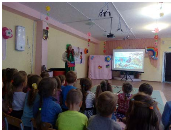
Рис. 1. «Урал – опорный край державы»

2. «Малахитовые бусы» – детям читали отрывки из сказа «Малахитовая шкатулка», затем они изготовили из пластилина украшения «Малахитовые бусы».