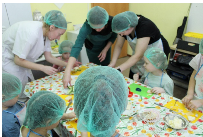
Рис. 1. Учимся готовить

В процессе образовательной деятельности используются проблемные ситуации, детское экспериментирование, сюжетно-ролевые игры, здоровьесберегающие и информационно-коммуникационные технологии. Содержание деятельности распределено по 4 блокам: «Учимся готовить» (рис. 1), «Учимся шить», «Учимся мастерить», «Мы конструируем» (рис. 2).