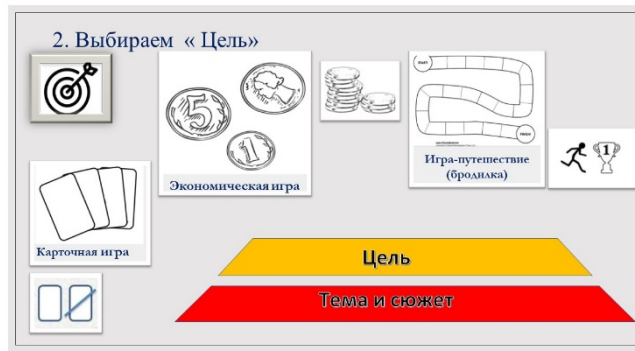
Рис. 4. Второй этап алгоритма создания игры «Пирамида Мастера игры»

3. После того, как цель выбрана, нужно определить, как нам ее достичь или как ходить. Это «Действия» (переворачивать карточки, бросать кубик, передвигать фишки и т. д.) (рис. 5).