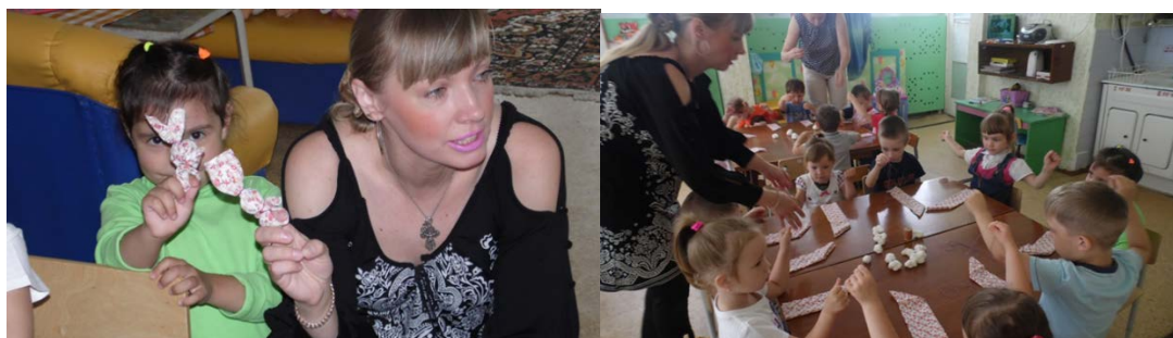
Рис. 8. «Кукла своими руками»

Клубный час: «Широкая масленица» , целью которого стало создание условия для приобщения дошкольников к русским народным праздникам через различные виды деятельности. В рамках данного клубного часа были организованы тематические клубы.