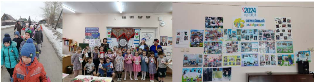
Рис. 6. Реализация технологии коллективного творческого

В своей работе мы провели различные театральные постановки, которые увлекли и детей, и взрослых. Семейные газеты стали прекрасным проектом, объединяющим родителей и детей в создании необычных изданий, наполненных историями, фотографиями и креативными иллюстрациями. Совместно с родителями мы также изготовили и установили кормушки для птиц, превращая обыкновенные занятия в увлекательные мастер-классы на свежем воздухе. Эти мероприятия не только способствуют развитию творческих способностей и интересов у детей, но и усилили семейные связи, привлекая родителей к активному участию в жизни дошкольного учреждения.