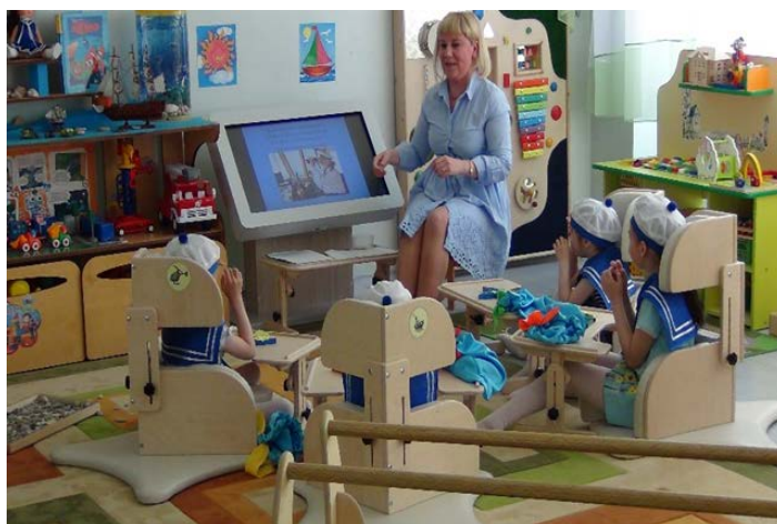
Рис. 1. Коррекционно-развивающая работа педагога-психолога