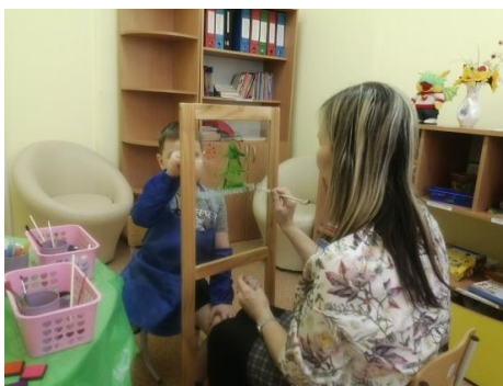
Рис. 3. Совместная работа с воспитанником, непосредственный контакт ребенок-педагог

Рисование на прозрачном мольберте в ходе коррекционно-развивающих занятий, раскрывает в детях то, что с помощью общения не всегда удастся. Рисуя на стекле, даже агрессивный, конфликтный ребенок получает возможность установить непосредственный контакт с другим человеком (с воспитанником или педагогом). В процессе совместной работы ребенок-ребенок, ребенок-взрослый – прозрачный арт-мольберт выполняет условно защитную функцию, когда легче установить контакт, вызвать ребенка на общение (рис. 3).