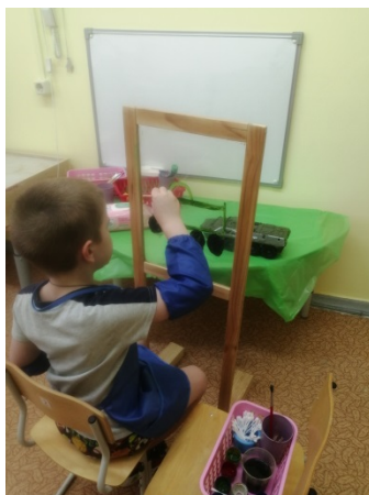
Рис. 6. «Рисуем с натуры»

«Рисуем с натуры» – развивает наблюдательность (рис. 6).