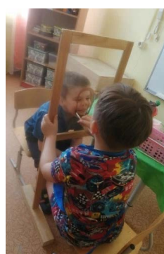
Рис. 2. «Портрет»