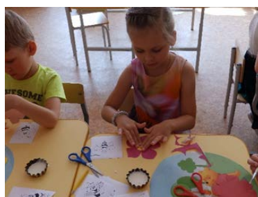
Рис. 5. Коллективная аппликация «Пчелки на цветочной поляне»

1. «Медовый Спас» – детей познакомили с Медовым спасом, показали презентацию, рассказали про Медовый спас, затем дети создали коллективную аппликацию «Пчелки на цветочной поляне» (рис. 5).