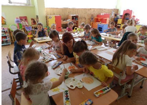
Рис. 6. «Яблочный Спас»

2. «Яблочный Спас» – детей познакомили с народным праздником «Яблочный спас». Затем дети, смешивая разные краски, рисовали «яблоко» (рис. 6).