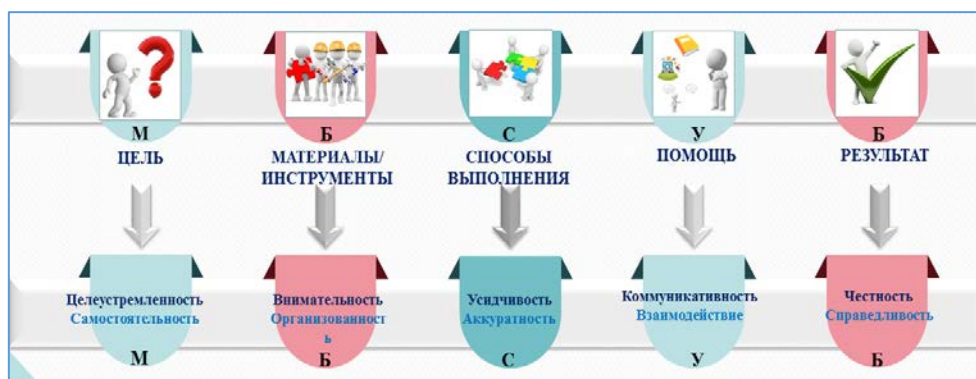
Рис. 2. Модель «Дружные ладошки»