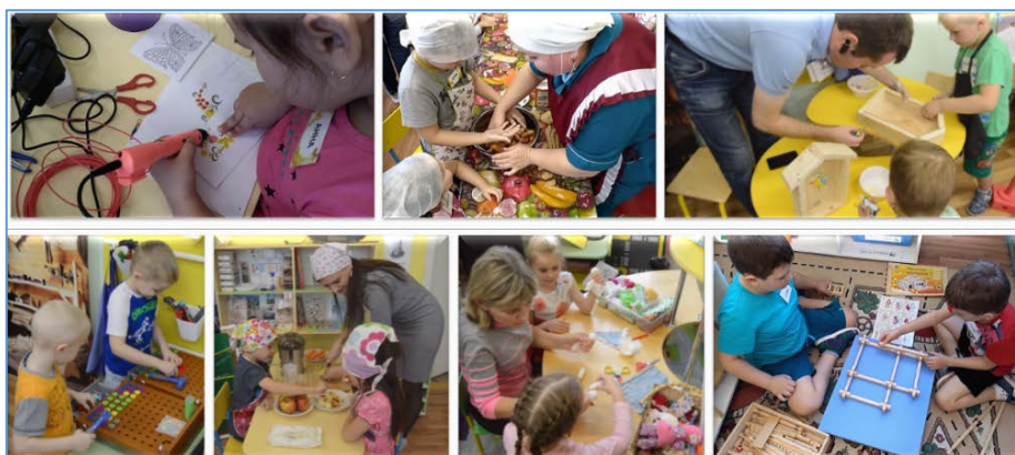
Рис. 4. Трудовая деятельность в «ремесленной мастерской»

3 этап «Рефлексивный». На рефлексивном этапе ребенок получает радость от работы и достигнутого результата, положительные эмоции. Проговаривает те качества, которые он приобрел, поработав в том или ином центре активности (мастерской). А самое главное – ребенок получает тот бесценный опыт, который он сможет применять и передавать в разных ситуациях (сделаю подарок, научу этому другого) (рис. 5).