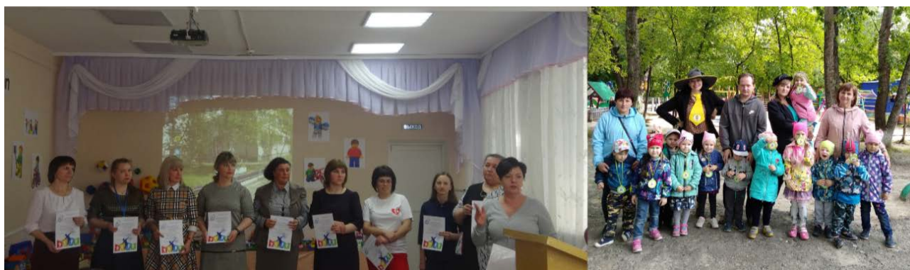
Рис. 2. Взаимодействие педагогов и родителей

Взаимное уважение и доверие составляет основу эффективного взаимодействия педагогов и родителей (рис. 2). Если раньше в ходе традиционных форм взаимодействия родители занимали позицию наблюдателей, слушателей, зрителей, то современные формы взаимодействия направлены на формирование активности, инициативности и родительской ответственности – субъектной позиции родителей, заинтересованных жизнью ребенка в детском саду.