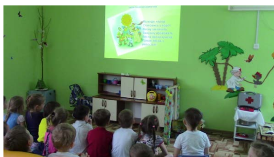
Рис. 11. «Масленица – широкая»

3. «Масленица – широкая» – детей познакомили с названием дней масленичной недели, особенностями каждого дня (рис. 11).