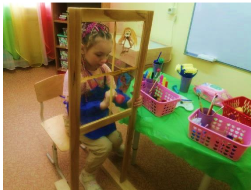
Рис. 10. «Радость»

«Рисуем стихи» – ребенку предлагалось послушать 4 коротких стихотворения «Радость», «Жалость», «Я плачу», «Я злой». Ребенок рисовал свой образ, свою ассоциацию к понравившемуся стихотворению (рис. 10).