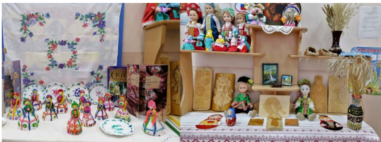
Рис. 4. Поддержка семейных духовно-нравственных ценностей

Наконец, важно повышать мотивацию родителей к участию в общественно-государственном управлении образовательными системами. Родители должны осознавать свою роль в образовании своих детей и активно сотрудничать с образовательной организацией. Их участие позволяет создать условия для обеспечения качественного образования и благоприятной среды для развития детей.