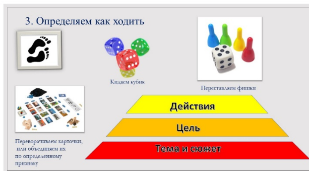
Рис. 5. Третий этап алгоритма создания игры «Пирамида Мастера игры»

3. После того, как цель выбрана, нужно определить, как нам ее достичь или как ходить. Это «Действия» (переворачивать карточки, бросать кубик, передвигать фишки и т. д.) (рис. 5).