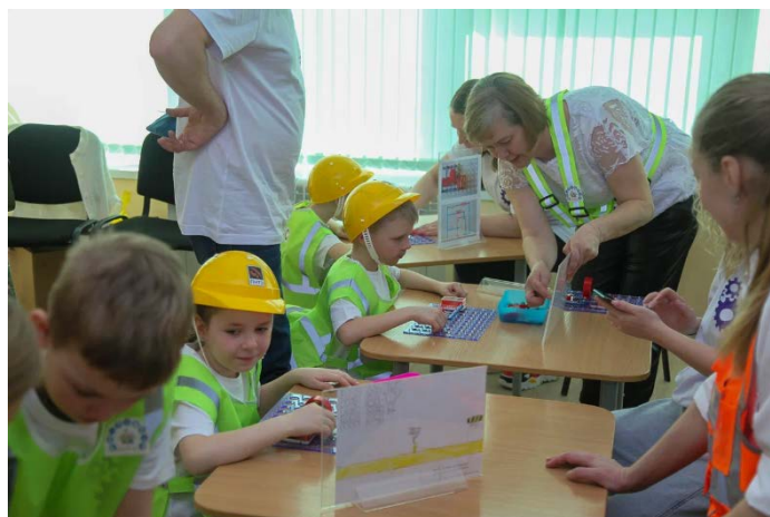
Рис. 2. Мы конструируем

Каждый блок состоит из тем, расположенных по сложности изучаемого материала с увеличением доли практических занятий. Каждое занятие состоит из двух частей – теоретической и практической. И подразумевает погружение в профессии: повар, кондитер, швея, портной, конструктор и дизайнер одежды, столяр, плотник, электромонтер, программист. В течение нескольких месяцев дети познакомились с кухонными помощниками, бытовыми приборами, сервировали стол к разным событиям, осваивали умение готовить бутерброды, собирали коллекции пуговиц, учились их пришивать. Держали в руках отвертки, дрели, много узнали о разнообразии пород древесины и ее свойствах, познакомились с измерительными приборами, читали схемы. Работая с конструктором «Зна-ток», узнали об электрических схемах, способах соединения и принципе их работы. Главными гостями у детей были родители, представители данных профессий. Родители смогли увлекательно представить особенности своих профессий.