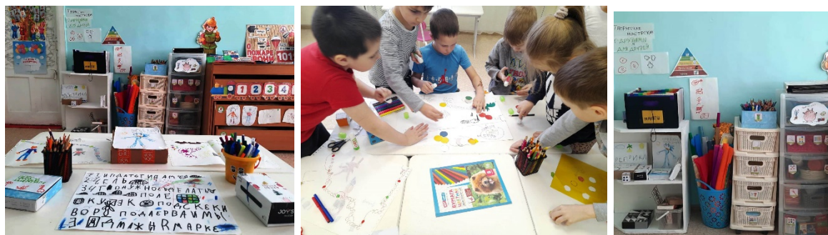
Рис. 1. Творческая лаборатория «С друзьями и для друзей»

В процессе создания игры, наряду с развитием умения общаться, у детей развивается логическое мышление, аналитические способности, фантазия, умение планировать свою деятельность и доводить начатое дело до конца (рис. 1).