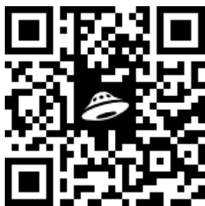
Алгоритмы «Моя игра»

В помощь родителям подобраны кейсы игровых заданий, направленных на нравственное воспитание дошкольников и разработаны карты-схемы «Моя игра», карты-алгоритмы для родителей по работе с игровыми заданиями «Ситуация-рассуждение», «Ситуация-загадка», «Ситуация-оценивания», «Ситуация «знаю-умею-делаю».