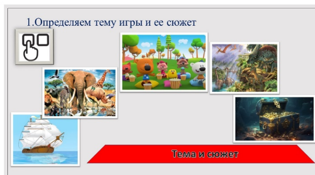
Рис. 3. Первый этап алгоритма создания игры «Пирамида Мастера игры»

1. Создавая игру, дети первым делом определяют тему игры и ее сюжет. Это может быть морское путешествие, мир животных и все, на что хватает фантазии (рис. 3).