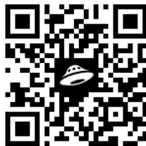
Кейсы игровых заданий