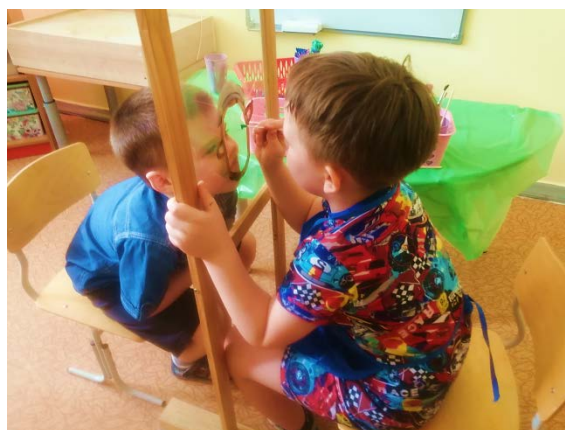
Рис. 9. «Портрет»

«Рисуем портрет» – развитие коммуникативных навыков, снятие эмоциональное напряжение (рис. 9).