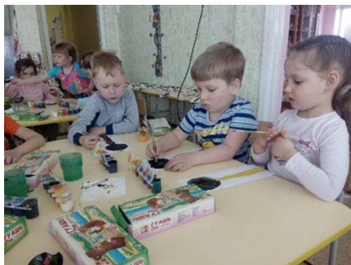
Рис. 3. «Урало-сибирская роспись»

1. «Урало-сибирская роспись» – где детей познакомили с незаслуженно забытым промыслом нашего края – урало-сибирской росписью, ее основными элементами и применением (рис. 3).