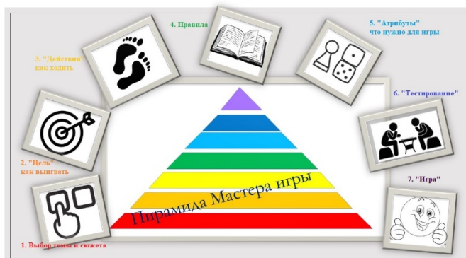
Рис. 2. Алгоритм «Пирамида Мастера игры»

Алгоритм создания авторской игры представляет собой пирамиду, где каждому этапу соответствует свой цвет и пиктограмма.