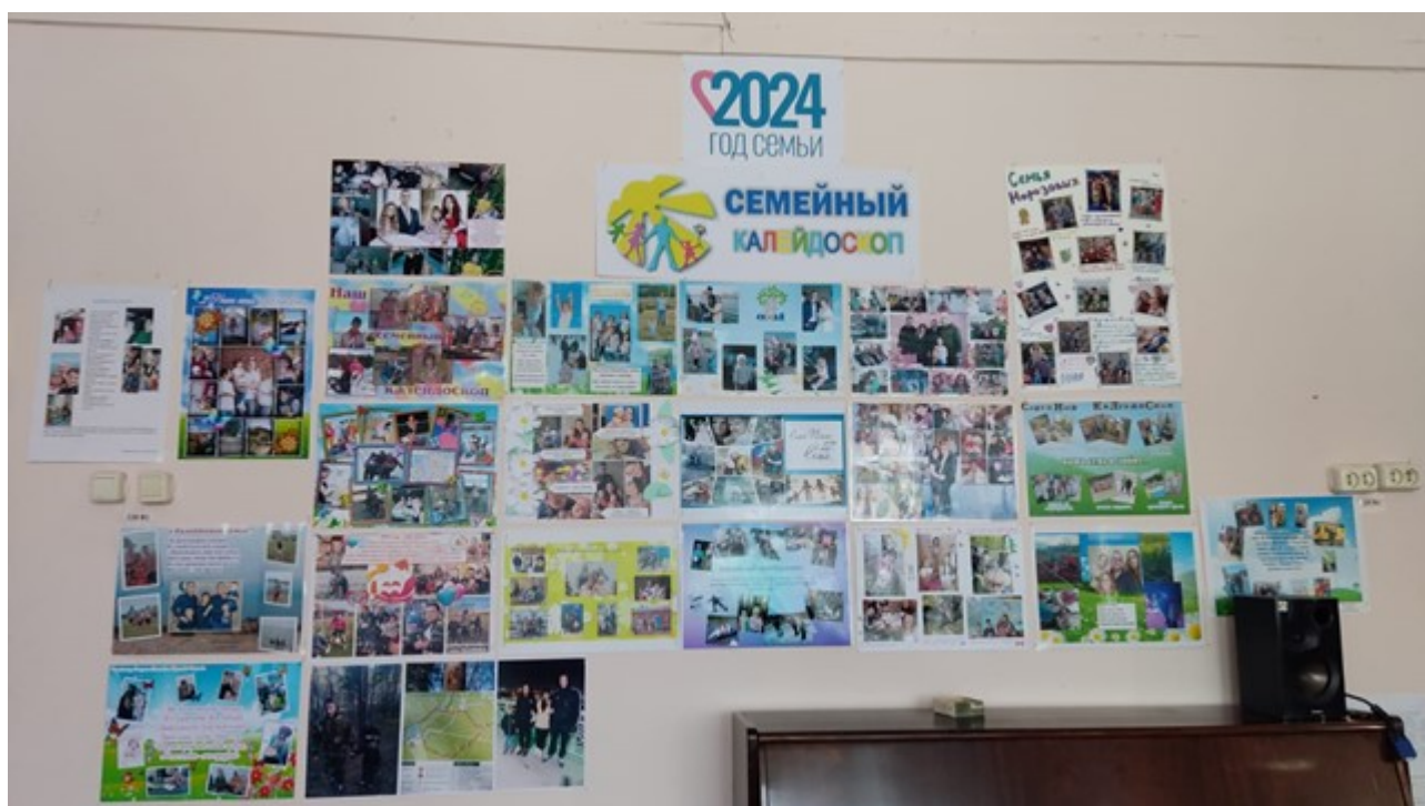
Рис. 5. 2024 год Семьи: «Семейный калейдоскоп»

Наконец, важно повышать мотивацию родителей к участию в общественно-государственном управлении образовательными системами. Родители должны осознавать свою роль в образовании своих детей и активно сотрудничать с образовательной организацией. Их участие позволяет создать условия для обеспечения качественного образования и благоприятной среды для развития детей.