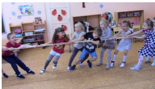
Рис. 9. «Русские народные игры»

2. «Масленичное солнышко» – непременно атрибутом Масленицы являются блины, которые олицетворяют солнце – символ того самого уюта и тепла, ну и, конечно, веселья. Детям предоставили возможность создать собственное солнышко (рис. 10).