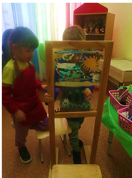
Рис. 11. «Времена года»

Рисование под музыку «Времена года» Антонио Вивальди направлено не только на самовыражение своего эмоционального состояния и эстетического восприятия, но и на развитие творческой активности, фантазии и воображения (рис. 11).