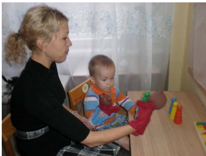
Рис. 2. Коррекционно-развивающая работа учителя-логопеда