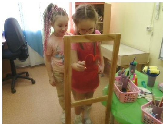
Рис. 8. Перенос рисунка на мольберт

«Рисуем портрет» – развитие коммуникативных навыков, снятие эмоциональное напряжение (рис. 9).